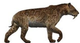
TIGRE DIENTE DE SABLE