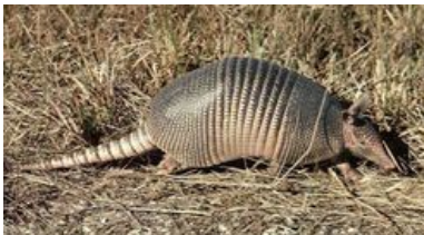
TATÚ CARRETA O MULITA